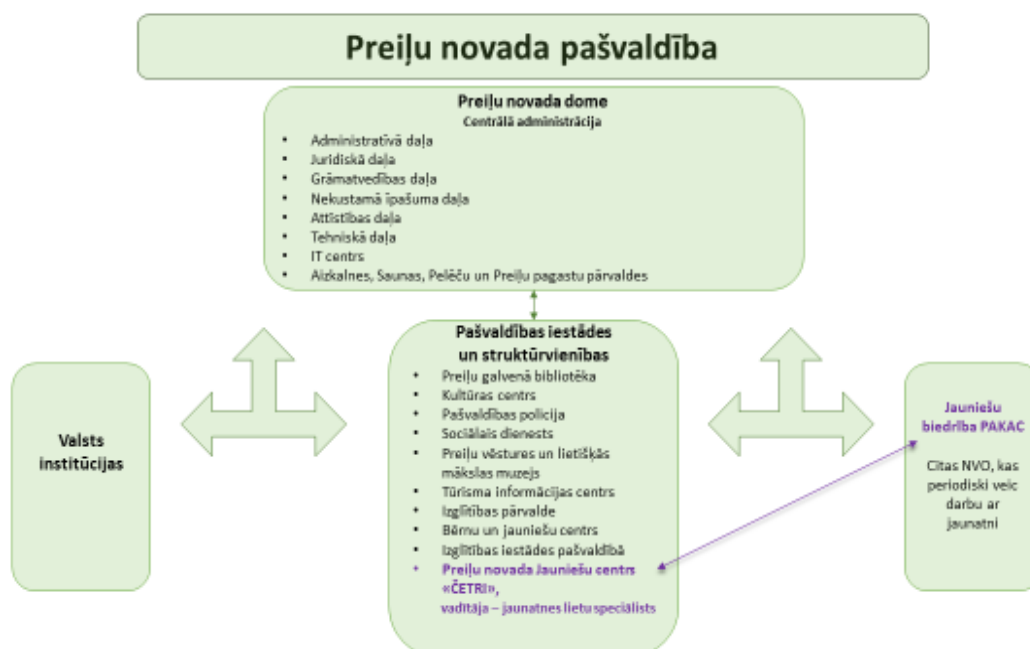
3.attēls Darba ar jaunatni shēma Preiļu novadā

Kopš 2015.gada 26.februāra (Preiļu novada domes sēdes protokols Nr.3, punkts 16) Preiļu novadā par darbu ar jaunatni ir noteikta atbildīgā pašvaldības institūcija – Preiļu novada Jauniešu centrs “ČETRI” (reģ.kods 90010643115), kā arī persona darbam ar jaunatni Preiļu novadā : Jauniešu centra “ČETRI” vadītājs - jaunatnes lietu speciālists.